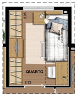
SUGESTÃO DE LAYOUT COM BELICHE