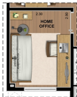
SUGESTÃO DE LAYOUT COM HOME OFFICE