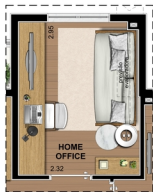
SUGESTÃO DE LAYOUT COM HOME OFFICE