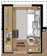
SUGESTÃO DE LAYOUT COM HOME OFFICE