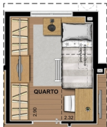
SUGESTÃO DE LAYOUT COM BELICHE