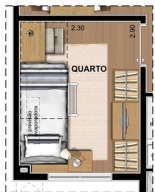
SUGESTÃO DE LAYOUT COM BELICHE