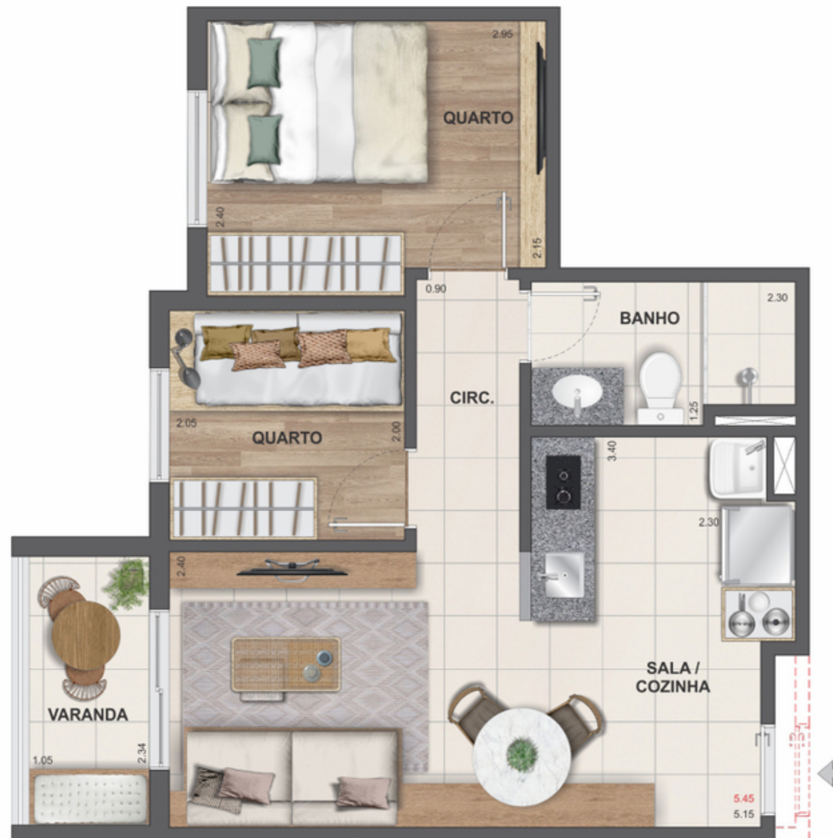
Alteração para os apartamentos 225 a 1125 do bloco 2.