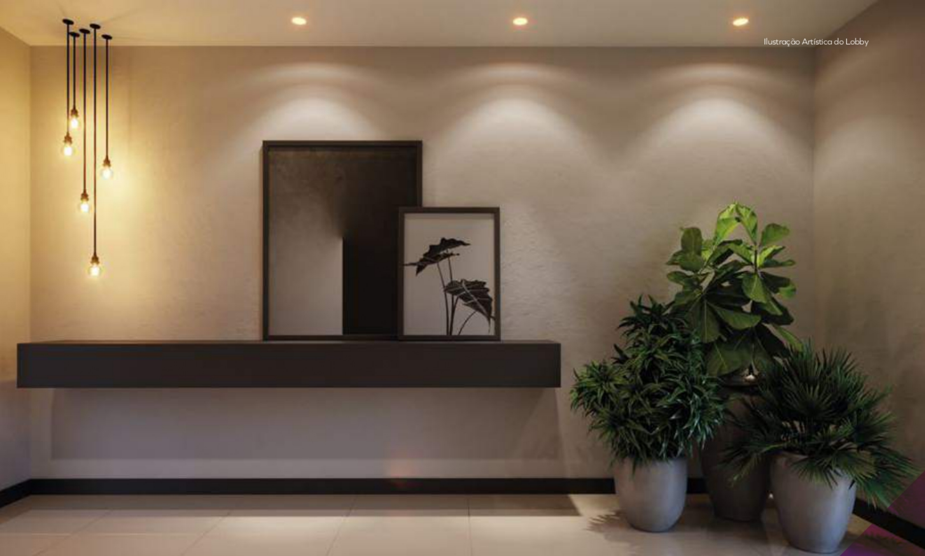
Ilustração Artística do Lobby