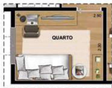
SUGESTÃO DE LAYOUT HOME OFFICE