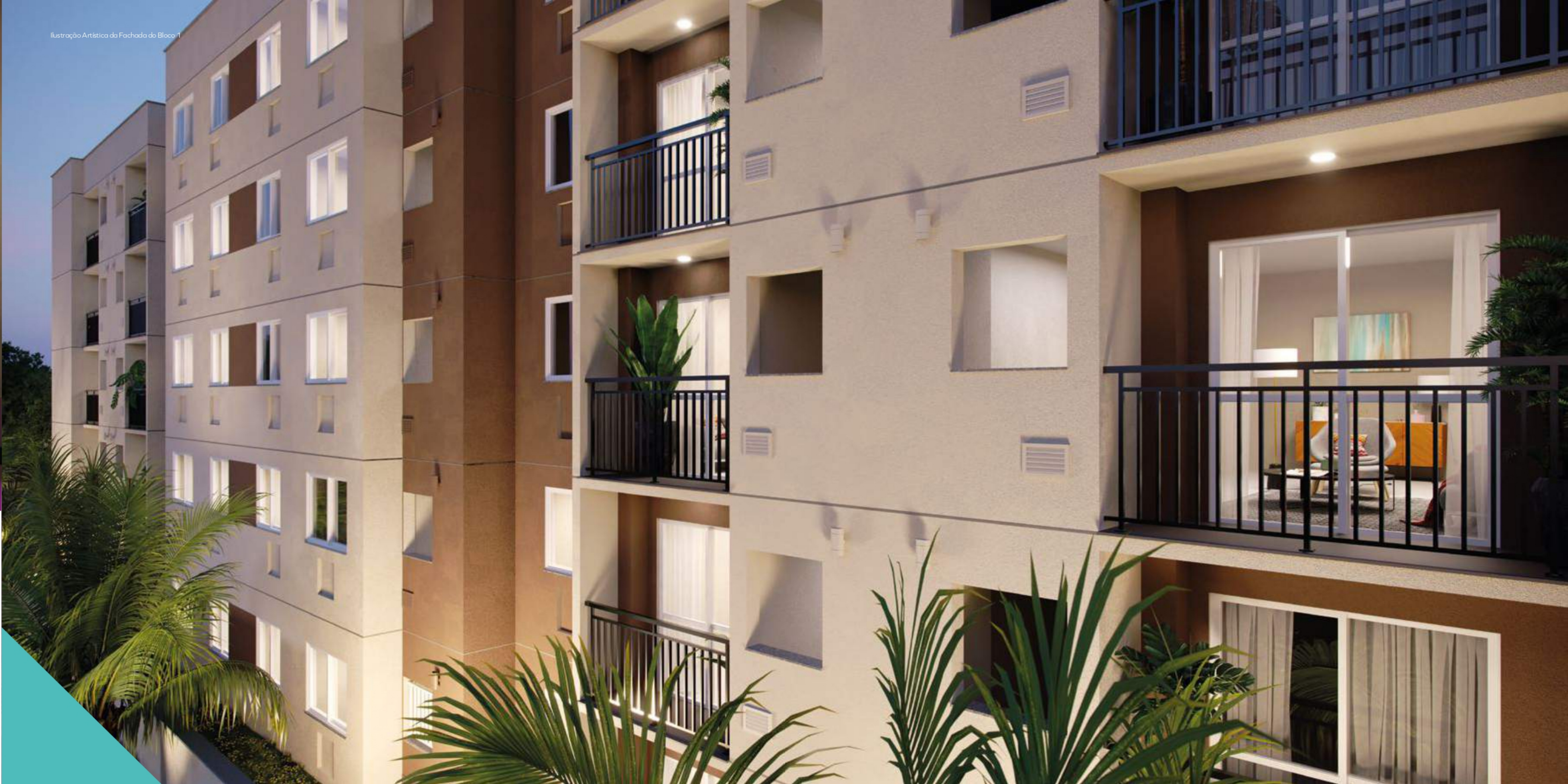
Ilustração Artística da Fachada do Bloco 1