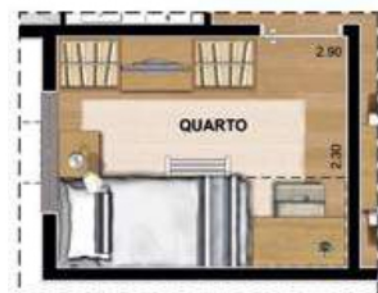
SUGESTÃO DE LAYOUT COM BELICHE