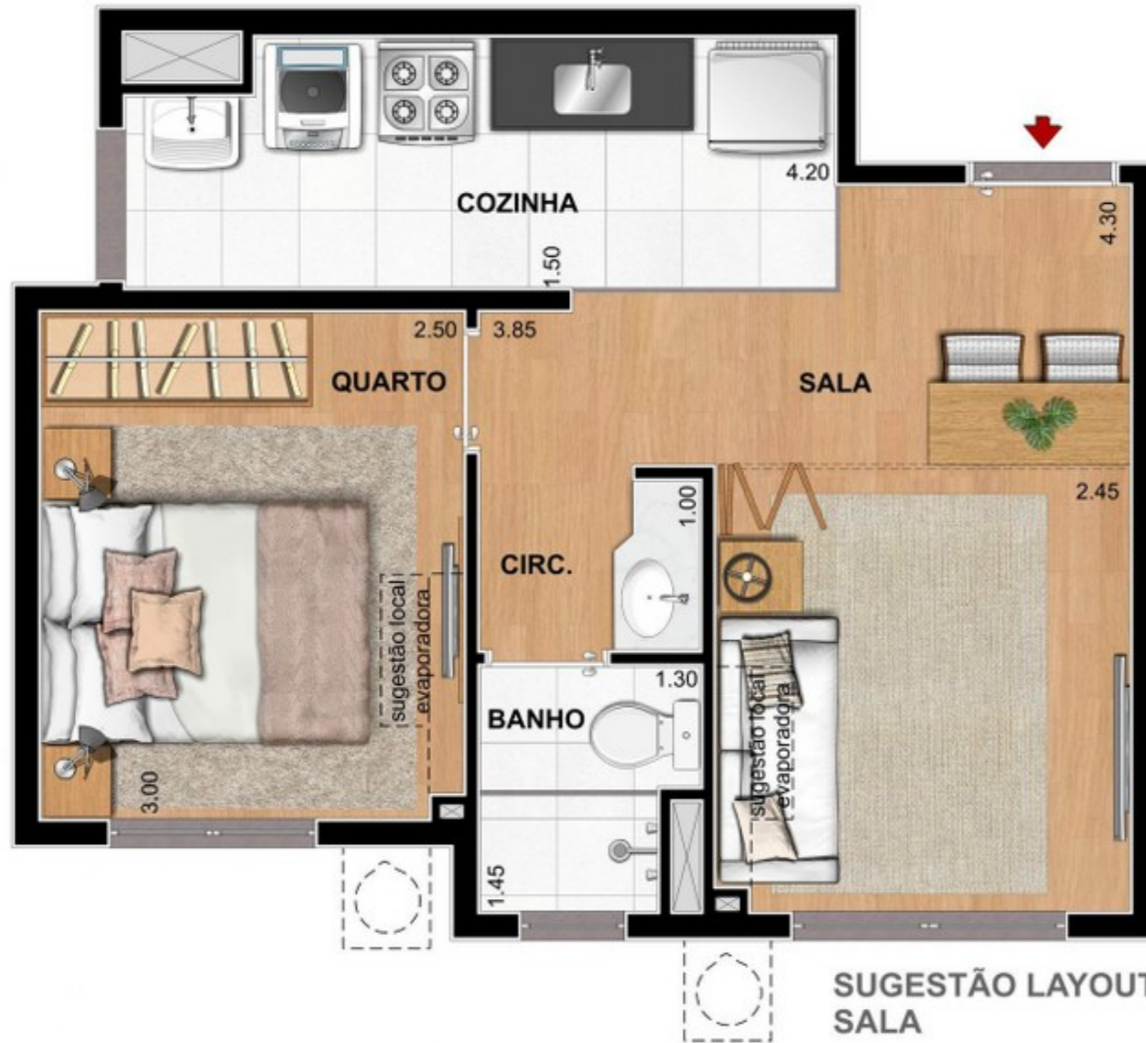
SUGESTÃO LAYOUT SALA