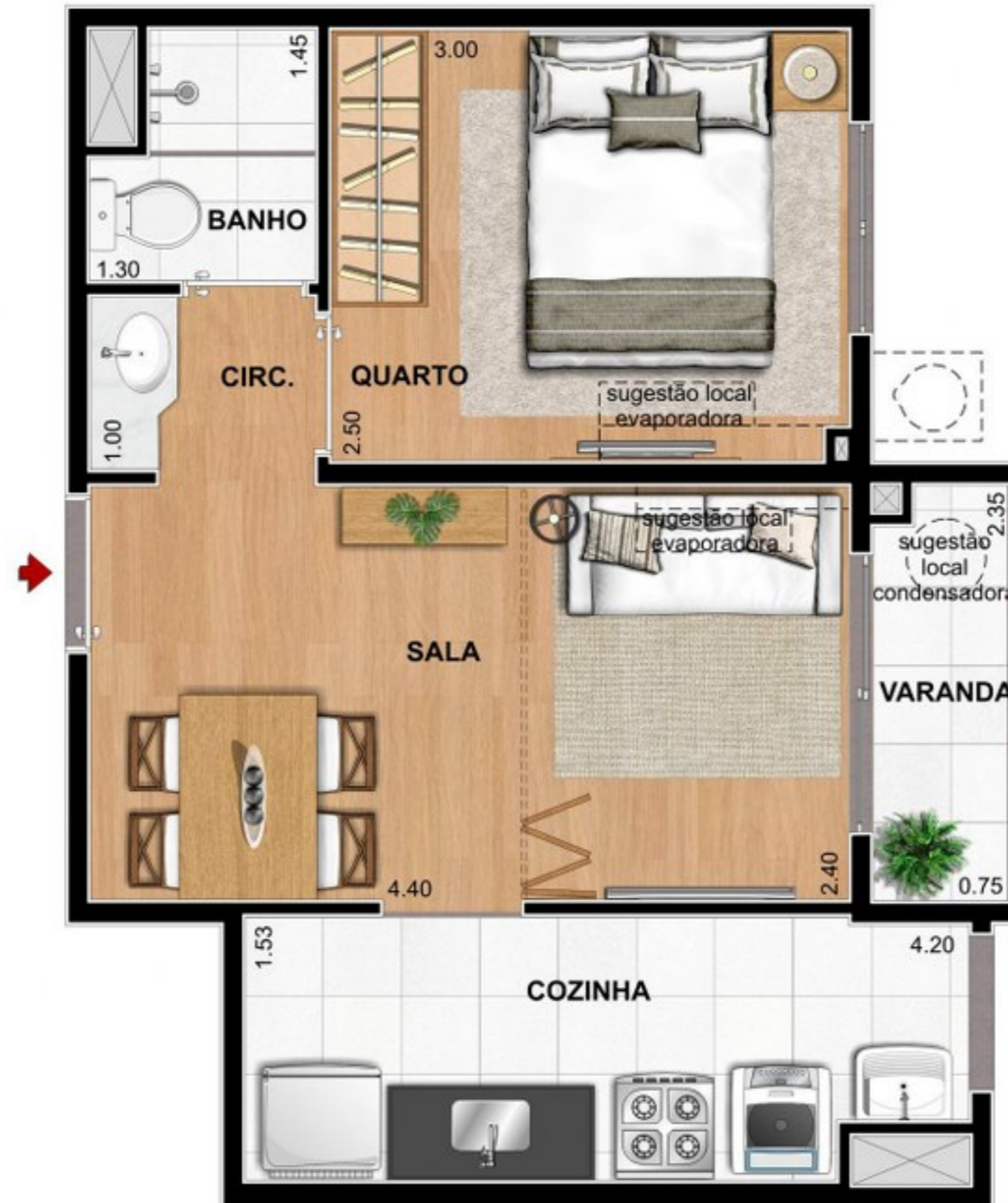
SUGESTÃO LAYOUT SALA