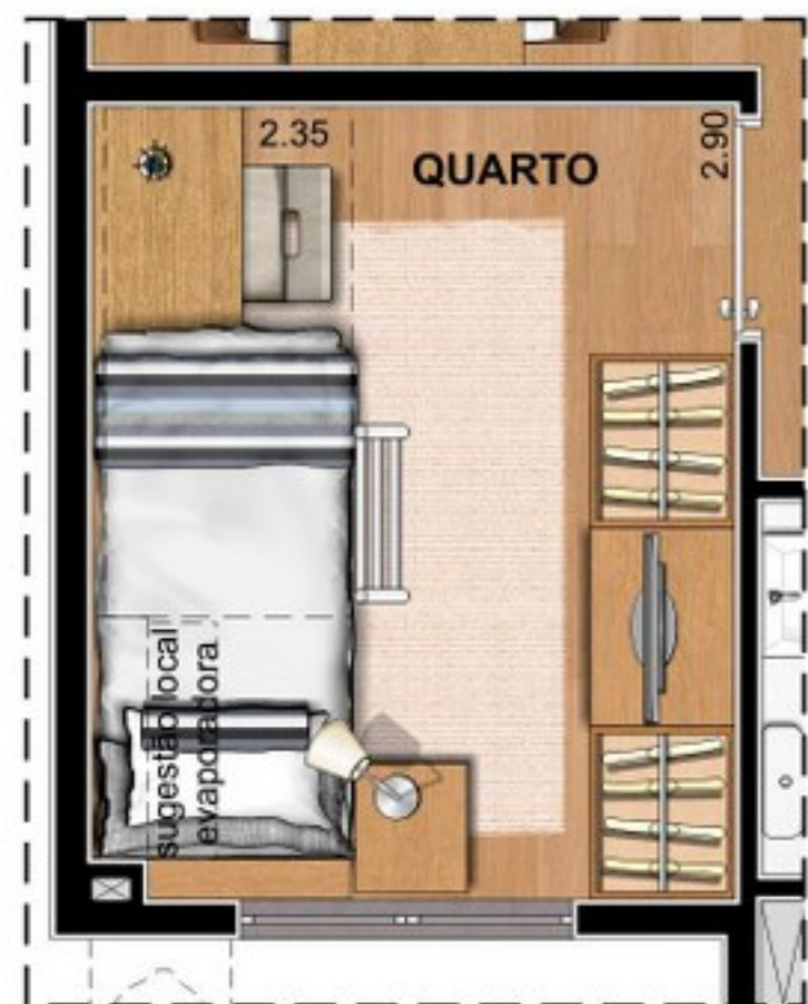
SUGESTÃO DE LAYOUT COM BELICHE