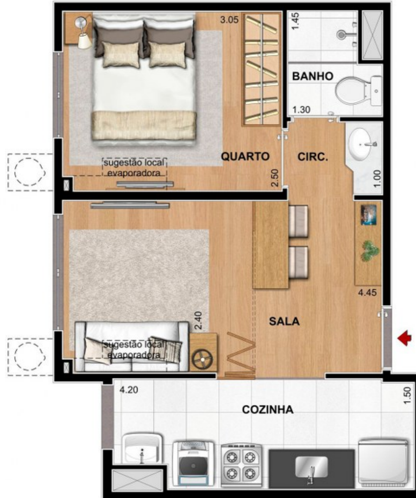
SUGESTÃO LAYOUT SALA