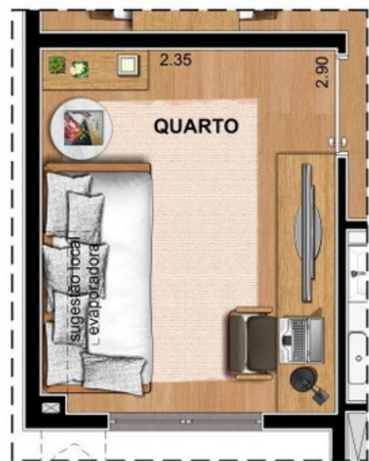
SUGESTÃO DE LAYOUT HOME OFFICE