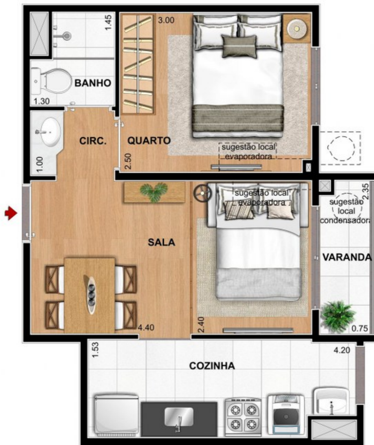
SUGESTÃO LAYOUT 2 QUARTOS