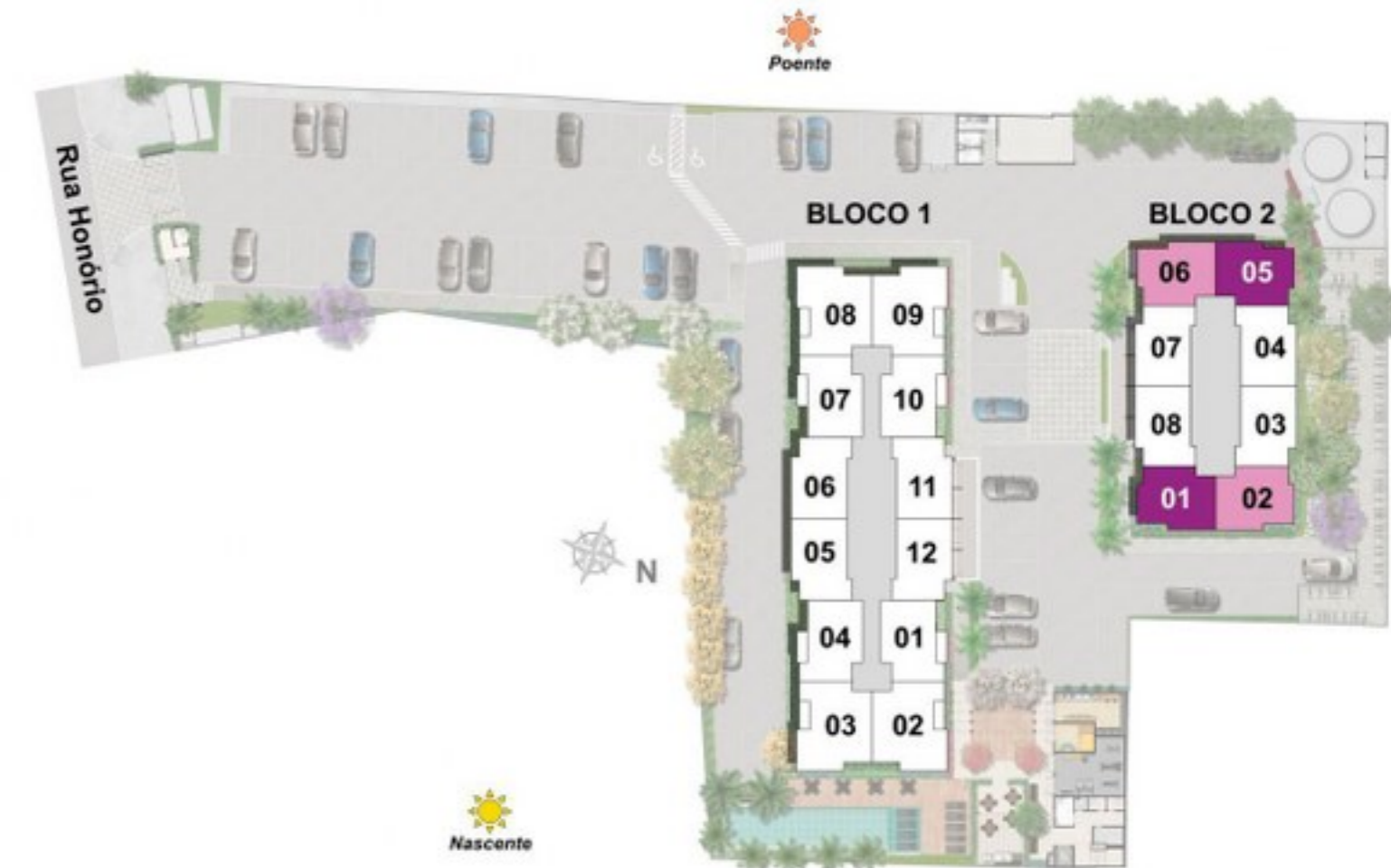
A presente planta ilustra referencialmente os apartamentos 101 a 1401 e 105 a 1405 do bloco 2, sendo os apartamentos 102 a 1402 e 106 a 1406 do bloco 2 espelhados.