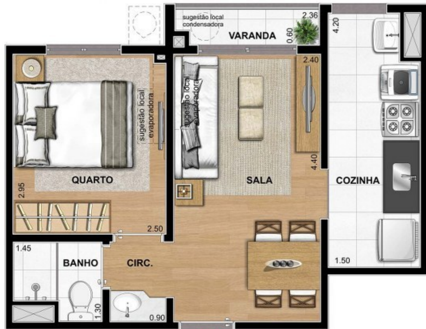
PLANTA HUMANIZADA PADRÃO