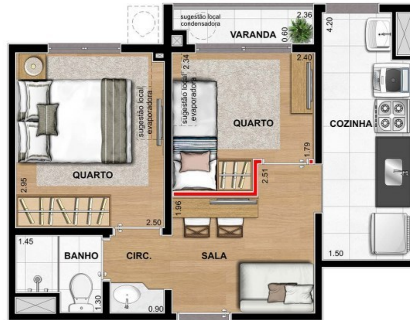
PLANTA HUMANIZADA COM DRYWALL