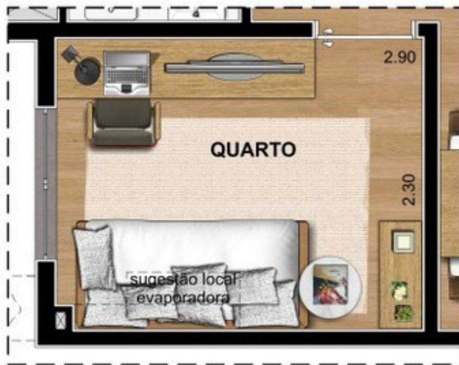
SUGESTÃO DE LAYOUT HOME OFFICE