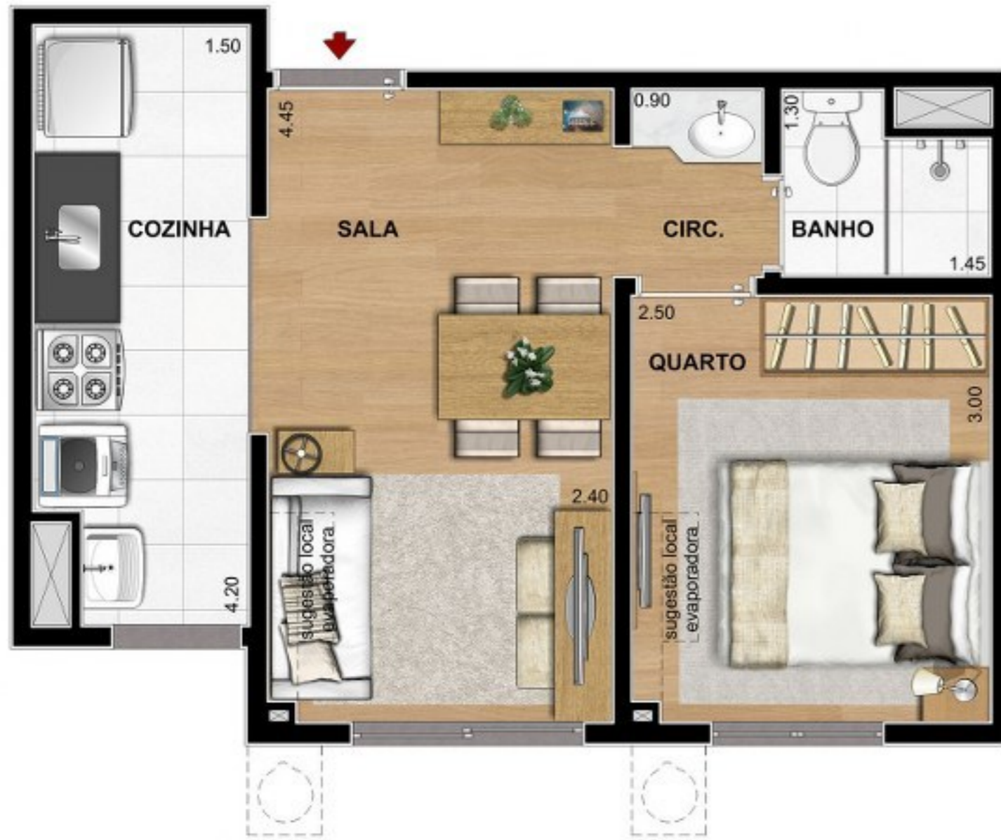
PLANTA HUMANIZADA PADRÃO