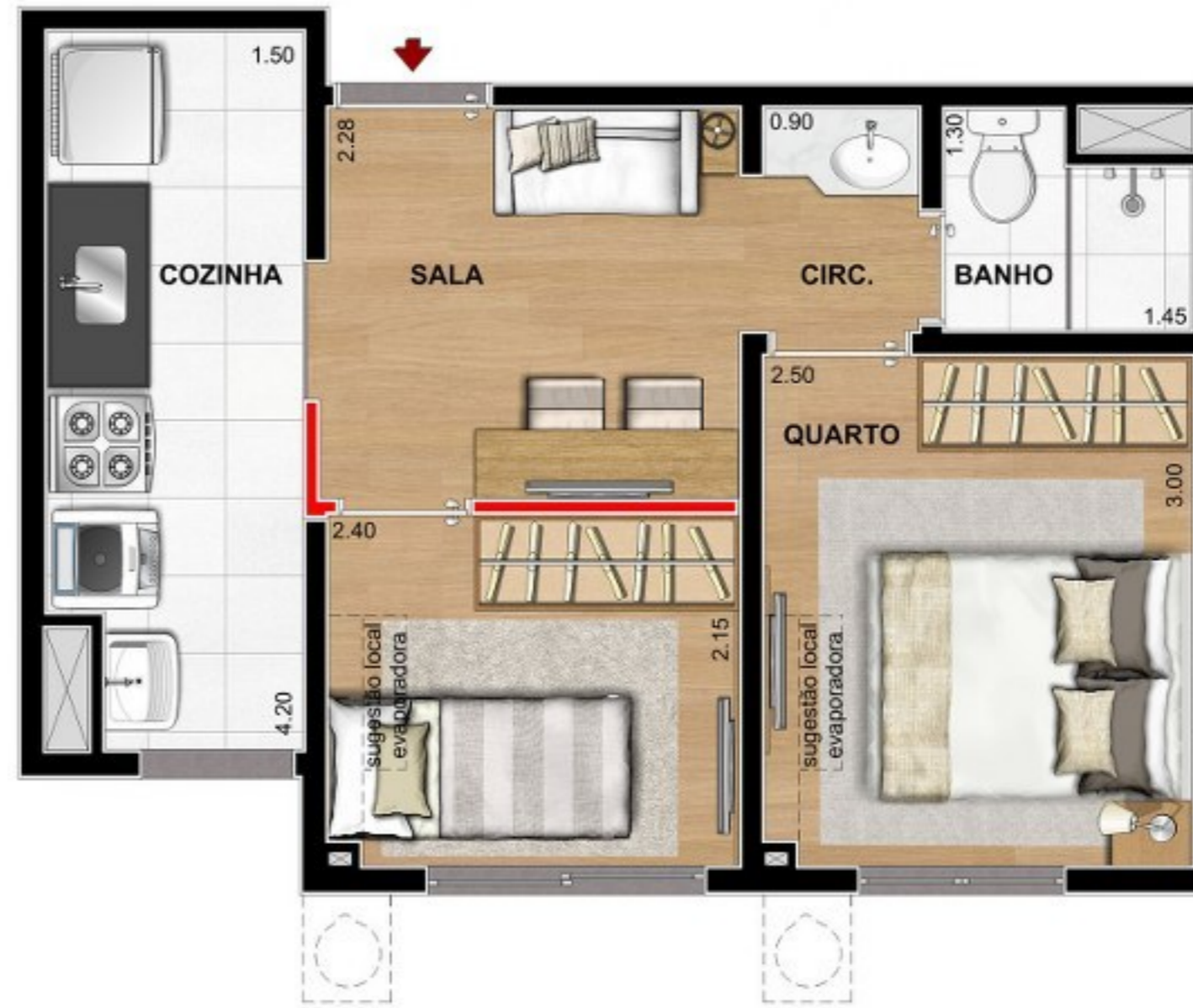
PLANTA HUMANIZADA COM DRYWALL