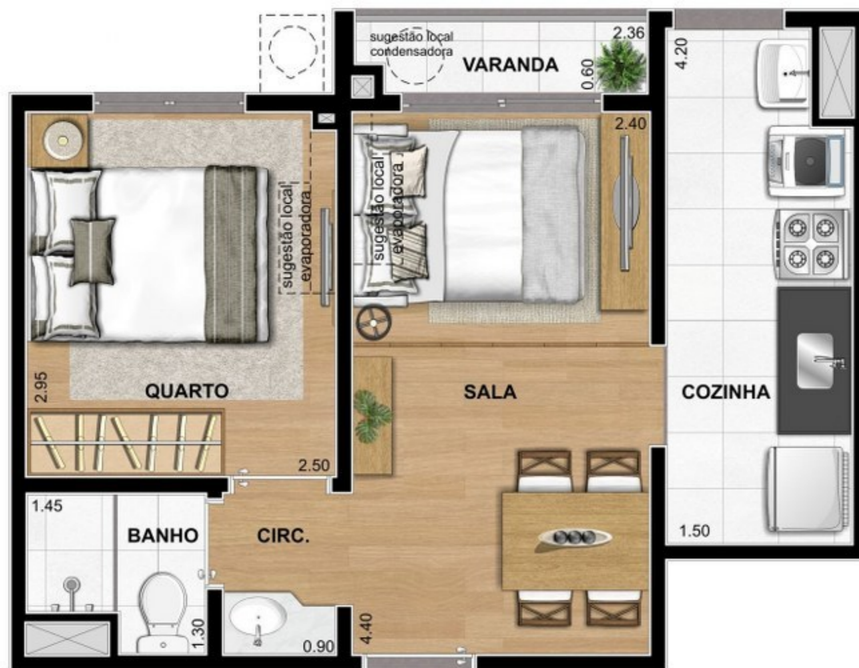
SUGESTÃO LAYOUT QUARTO