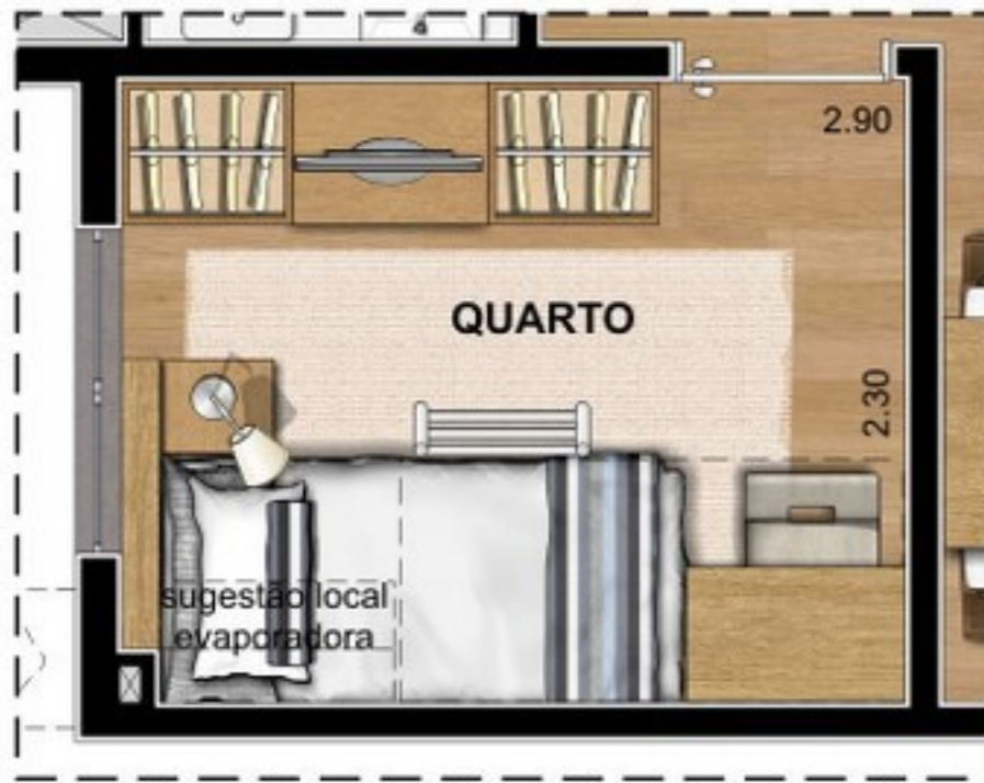
SUGESTÃO DE LAYOUT COM BELICHE