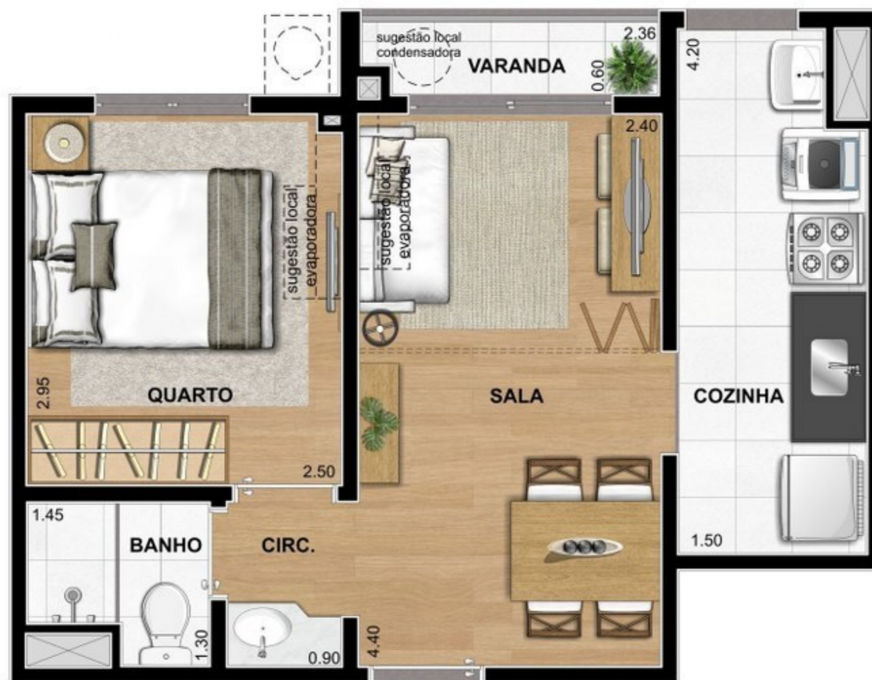
SUGESTÃO LAYOUT SALA