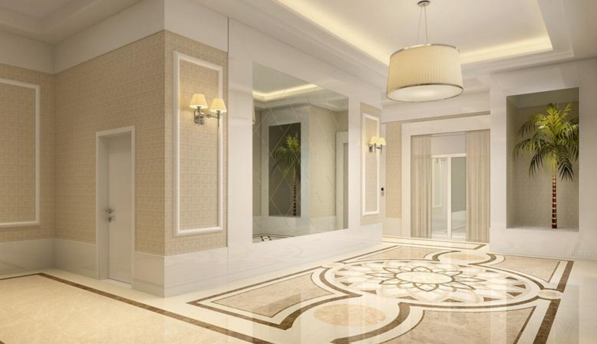
Perspectiva Ilustrada do Lobby do Ed. Salt Lake e Referência ilustrativa do Ed. Lake Tahoe