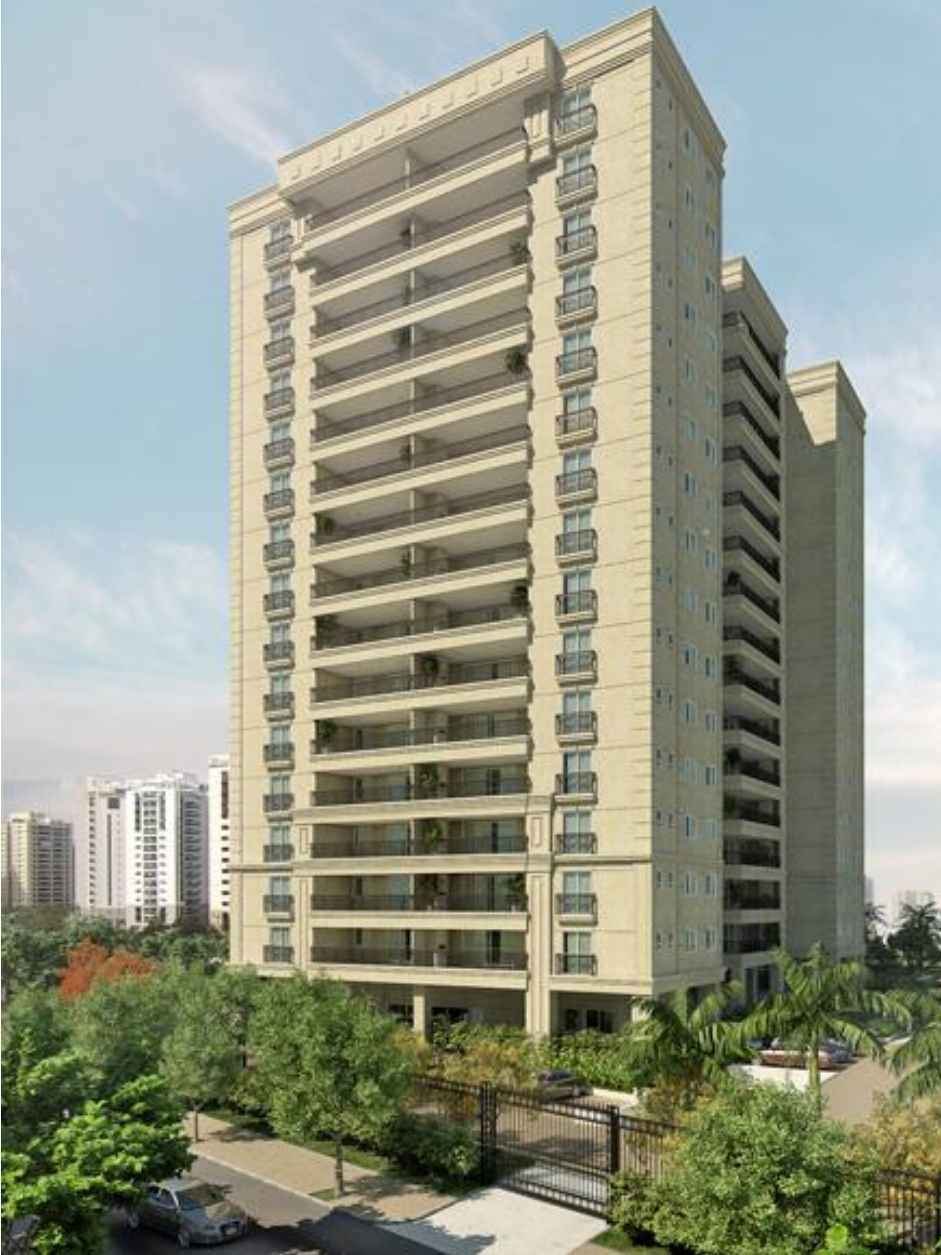
Perspectiva Ilustrada da Fachada do Ed. Lake Tahoe e Referência ilustrativa do Ed. Salt Lake