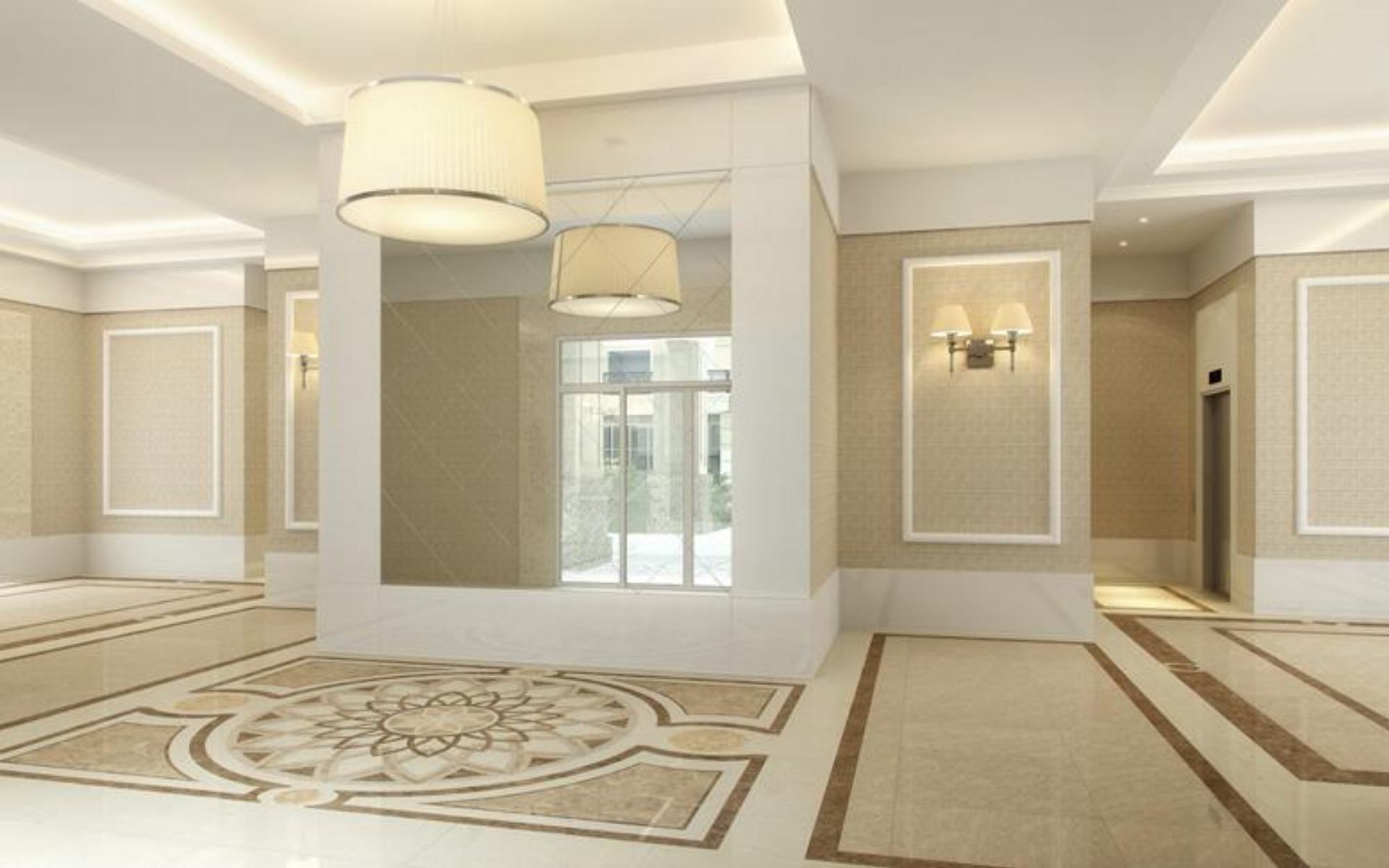
Perspectiva Ilustrada do Lobby do Ed. Hyde Park e Referência ilustrativa do Ed. Central Park