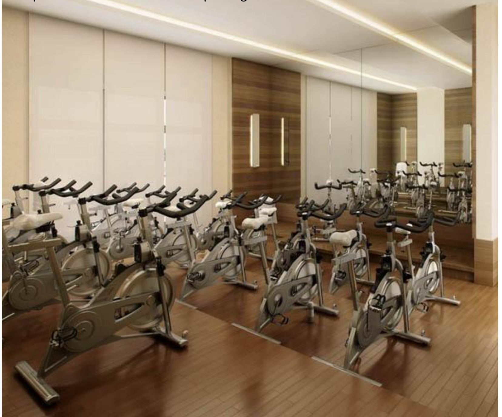
Perspectiva Ilustrada da Sala de Spinning