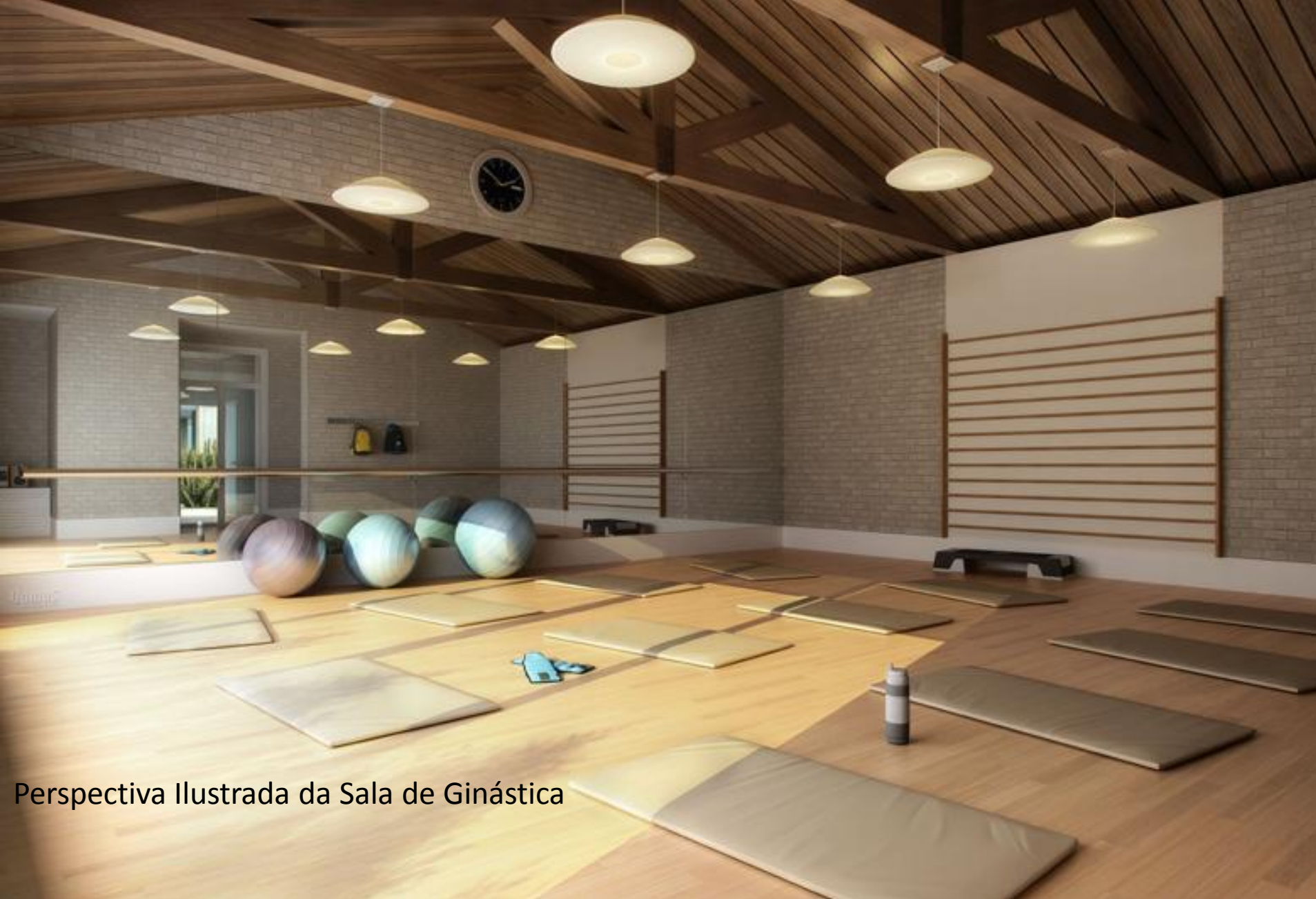
Perspectiva Ilustrada da Sala de Ginástica