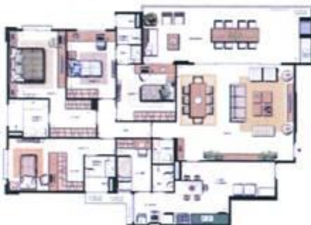
ED. CENTRAL PARK / ED. HYDE PARK 1º AO 14º PAV. - COL. 01 E 02