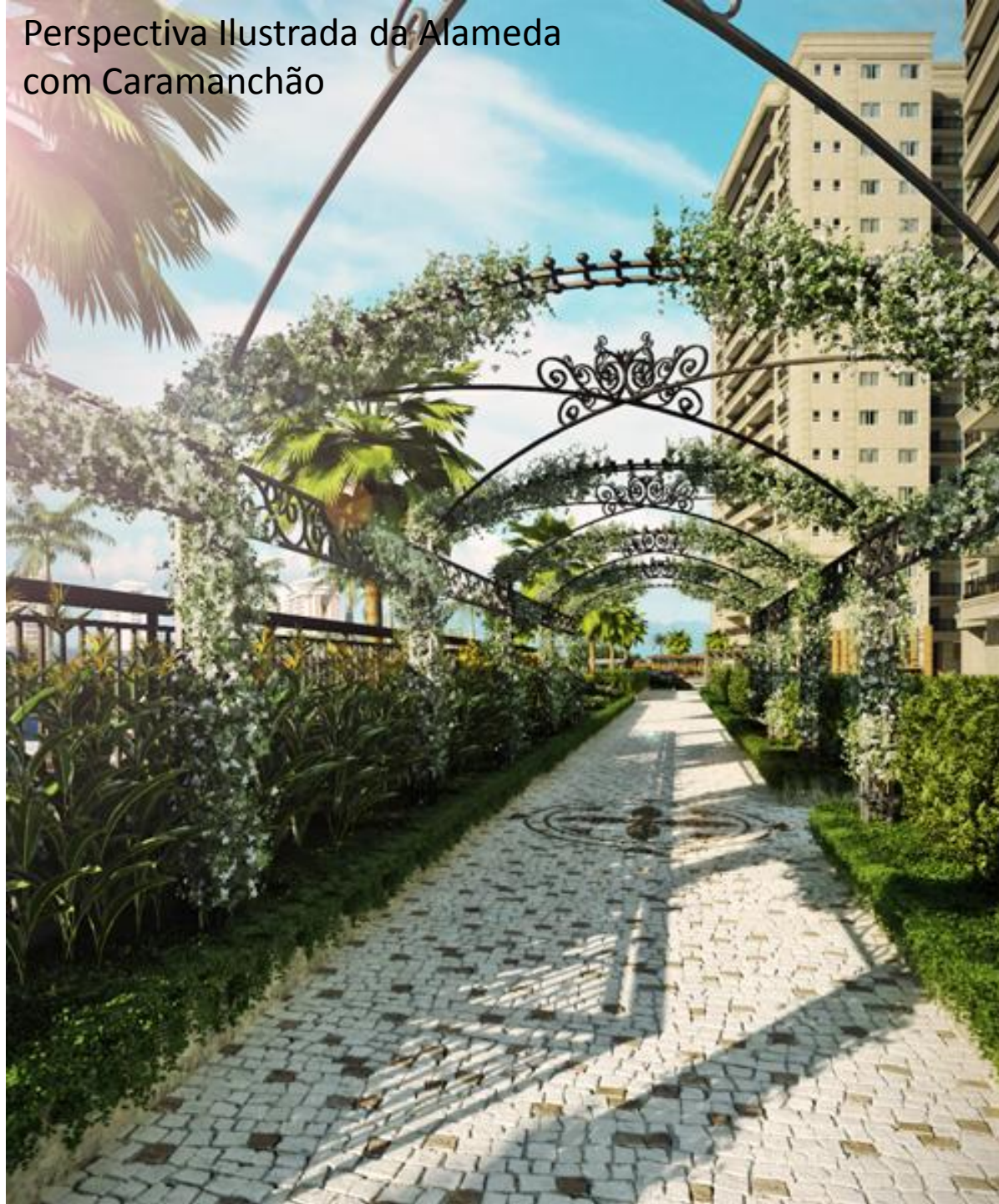
Perspectiva Ilustrada da Alameda com Caramanchão