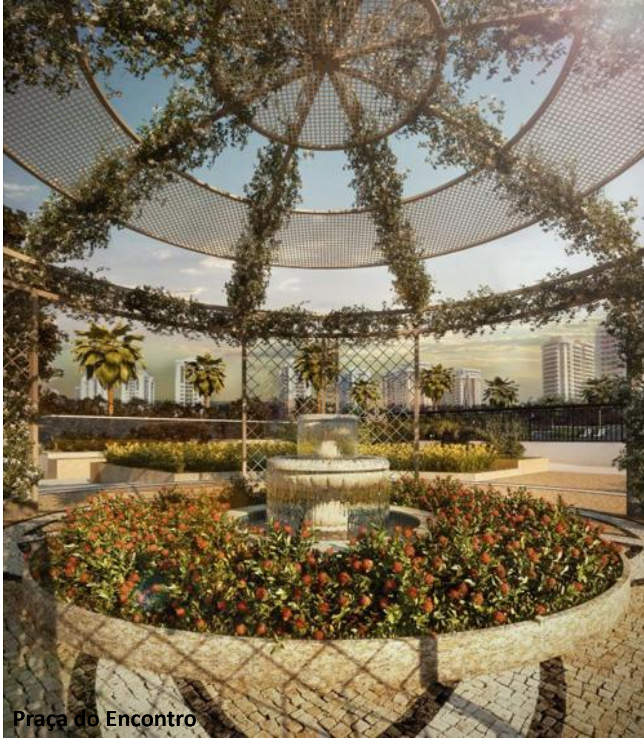
Praça do Encontro