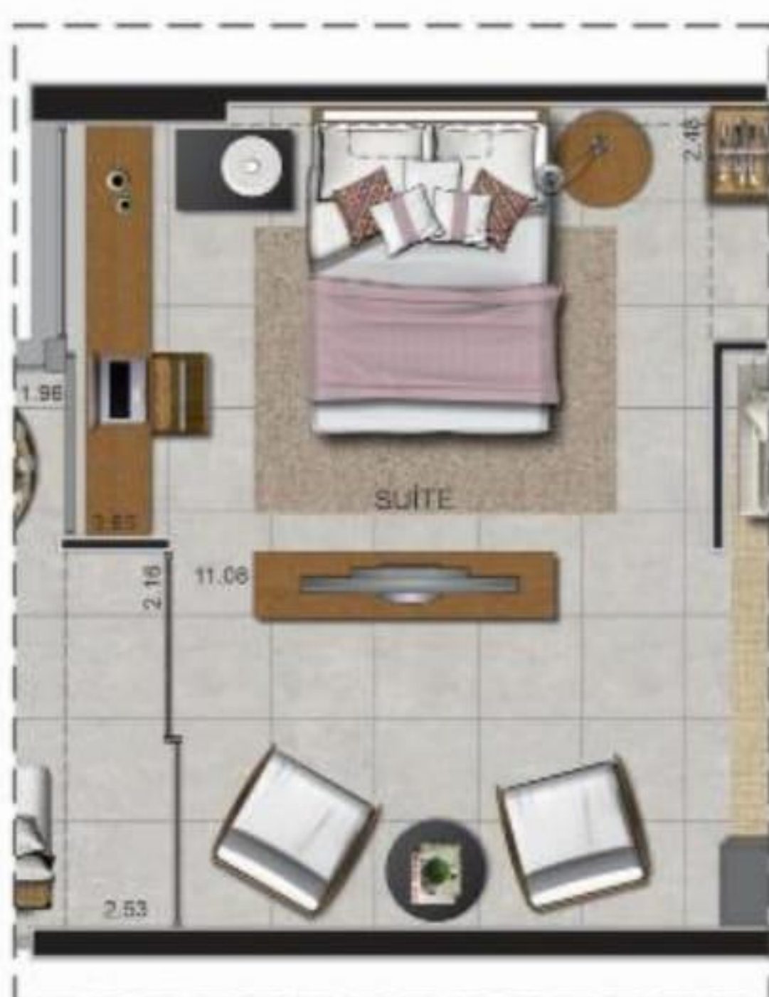
OPÇÃO 02: SUÍTE INTEGRADA A SALA