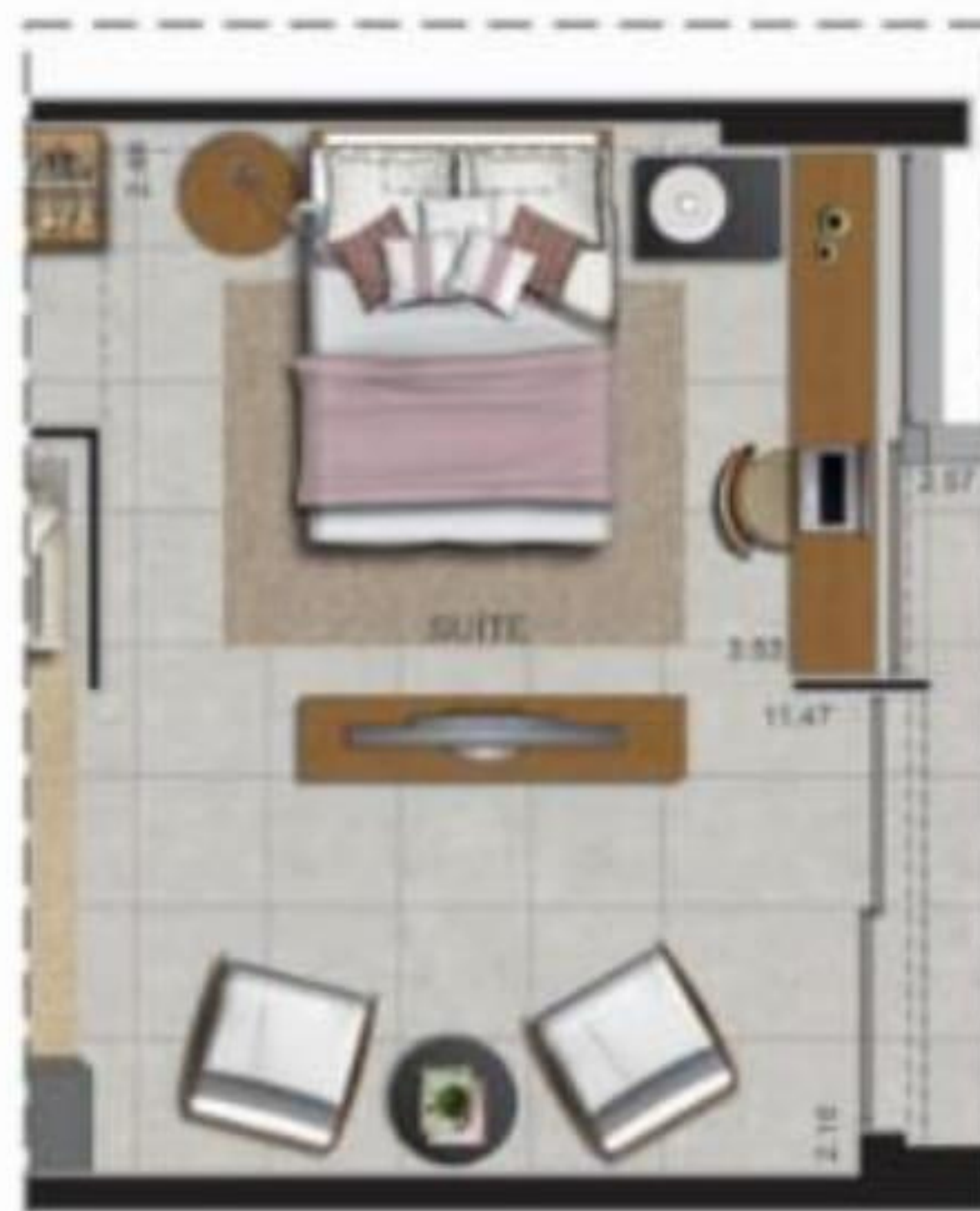
OPÇÃO 02: SUÍTE INTEGRADA A SALA