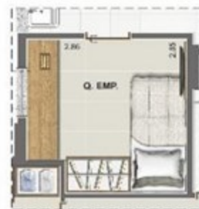
OPÇÃO QUARTO DE EMPREGADA