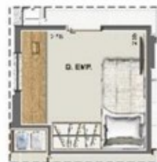
OPÇÃO QUARTO DE EMPREGADA