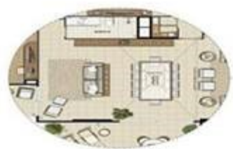
OPÇÃO 1 - SALA AMPLADA