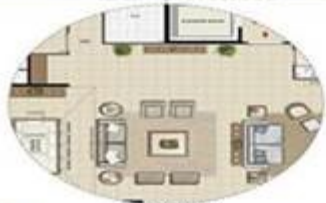
OPÇÃO 2 - SALA AMPLADA