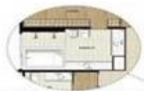
OPÇÃO 1 - BANHEIRO COM BANHEIRA SUITE BT